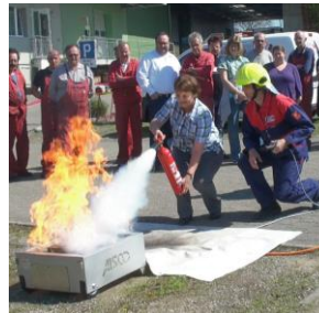
Flächenbrand löschen mit CO 2 Löscher