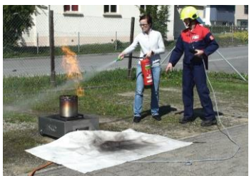
Papierkorbbrand löschen mit Wassernebellöscher