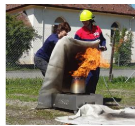
Flächenbrand löschen mit Löschdecke